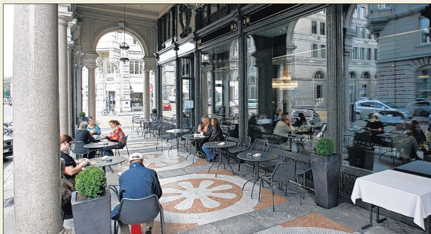
«METROPOL» Cappuccino und Langusten-Schwänze statt Steueramt.

UNTER ARKADEN lässt sich draussen Kaffee trinken und Passanten nachgucken. Drinnen erwartet zuerst die mit dunklen Holz- und Polstermöbeln gediegen gestaltete Bar den Gast. Sie bietet Mittags-Menüs für 29 Franken,